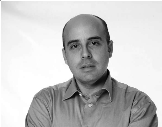
José Carlos Mariátegui