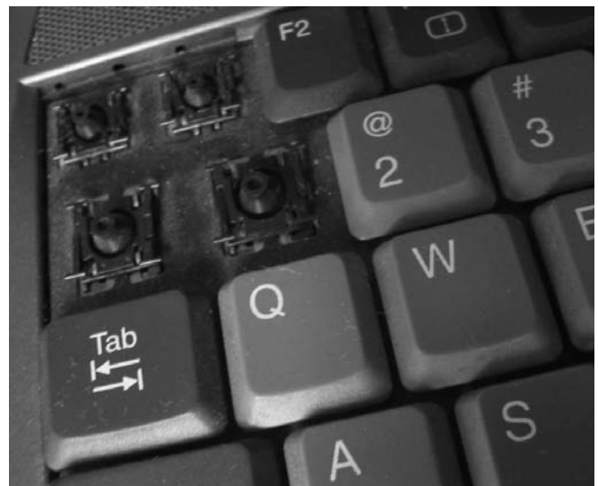
_la máquina podrida_ brian mackern